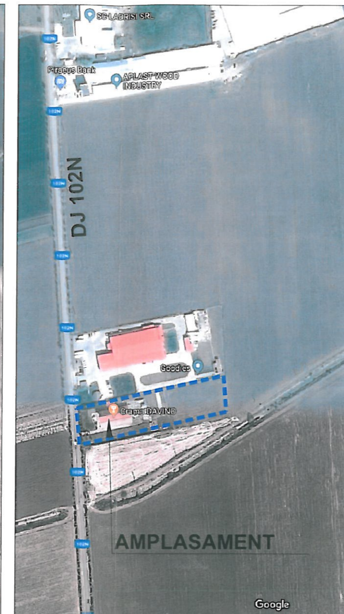
INCADRARE IN ZONA sc 1:5000